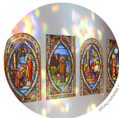
Vendée Vitrail © Stéphane Durcept