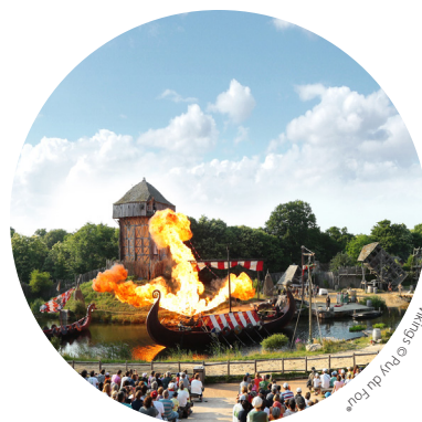
Spéciale Les Vikings © Joly de La...