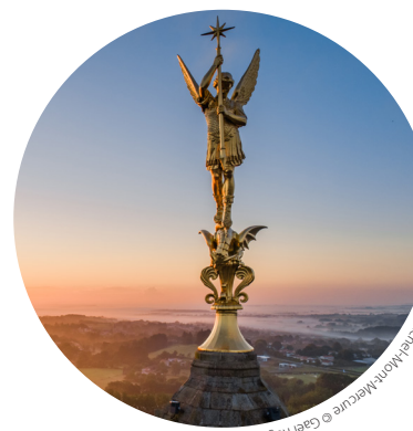
Échange de l'église de Saint-Michel-Monnières