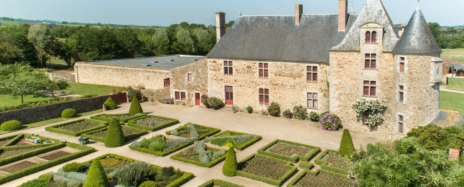
Le logis de la Chabotterie