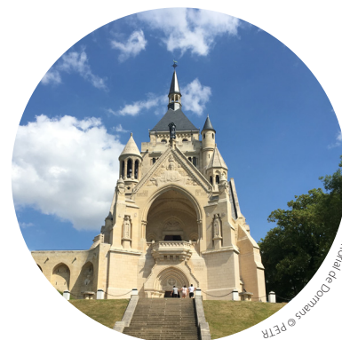
Mémorial de Dormans