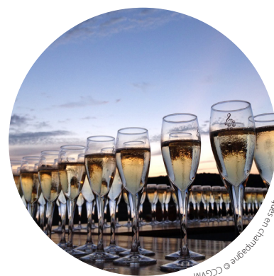
Musiques en Champagne