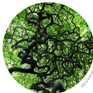
Forêt de Reims