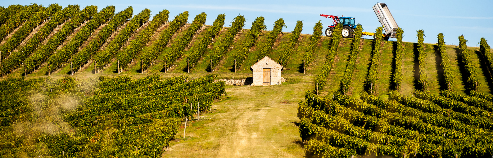
Vignoble de Saint-Pourçain