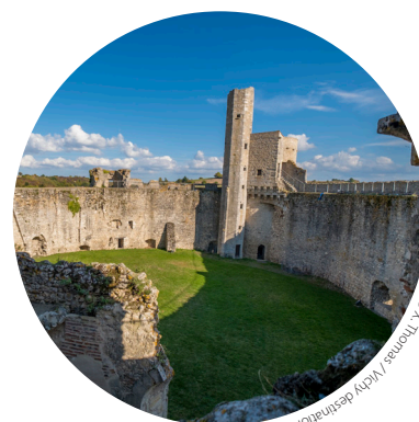
Forteresse de Billy