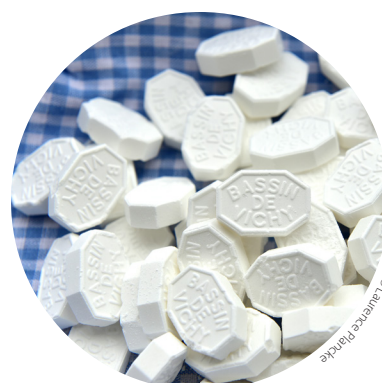
La pastille de Vichy