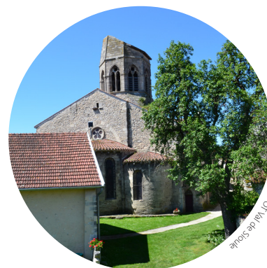
Eglise de Charroux