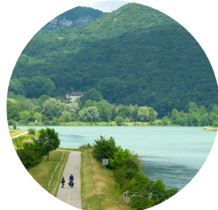
Le Rhône et ViaRhôna entre Seyssel et Belley - Bugey (01)