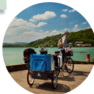
Le Rhône à Condrieu (69)

Téléchargez gratuitement l'application Hachette SCAN, scannez la couverture et les pages de ce guide pour accéder à des contenus inédits.