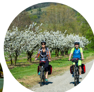
alentours de Tournon