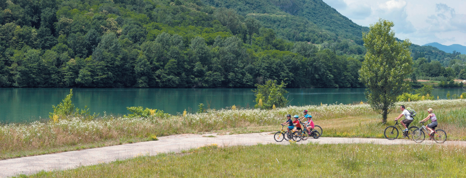
Le Rhône et ViaRhôna entre Belley et Bregnier-Cordon - Bugey (01)