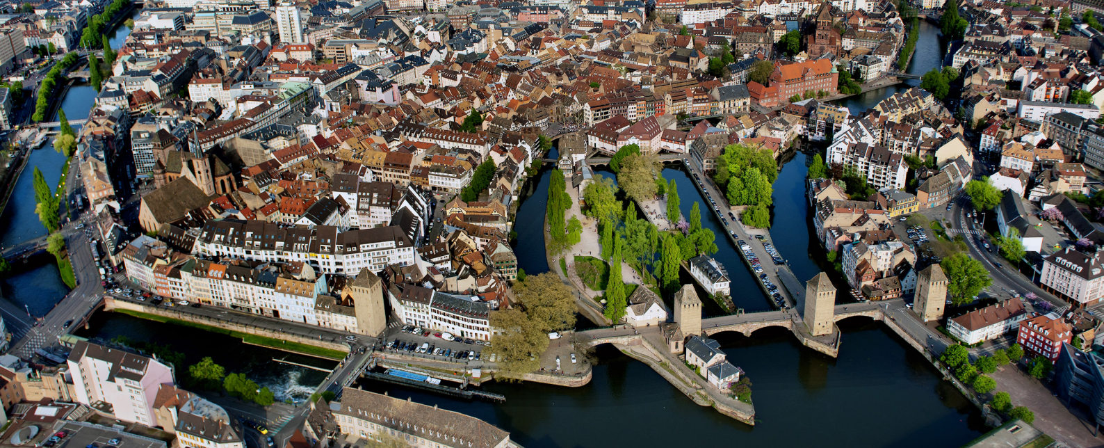
La Grande Île. Strasbourg, cité aquatique