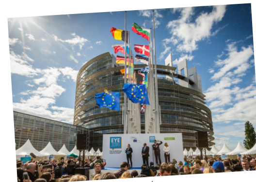
European Youth Event au Parlement européen Architecture-Studio-Adagp, Paris, 2018