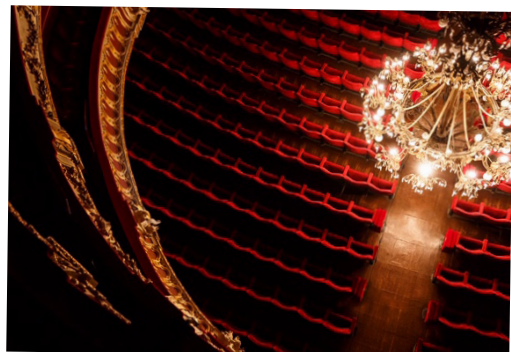
Un soir à l'Opéra du Rhin