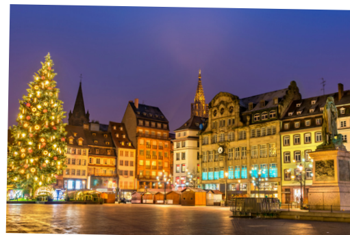
Capitale de Noël. Sur la place Kléber