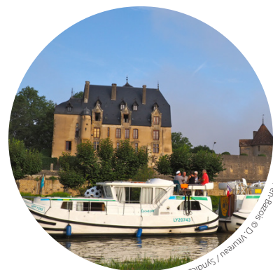
Château de Châtillon-en-Bazois