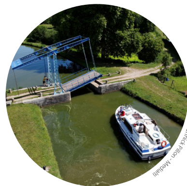
Pont-levis de Dico