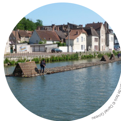
Traîn de bois