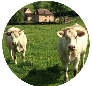
Boeuf charolais