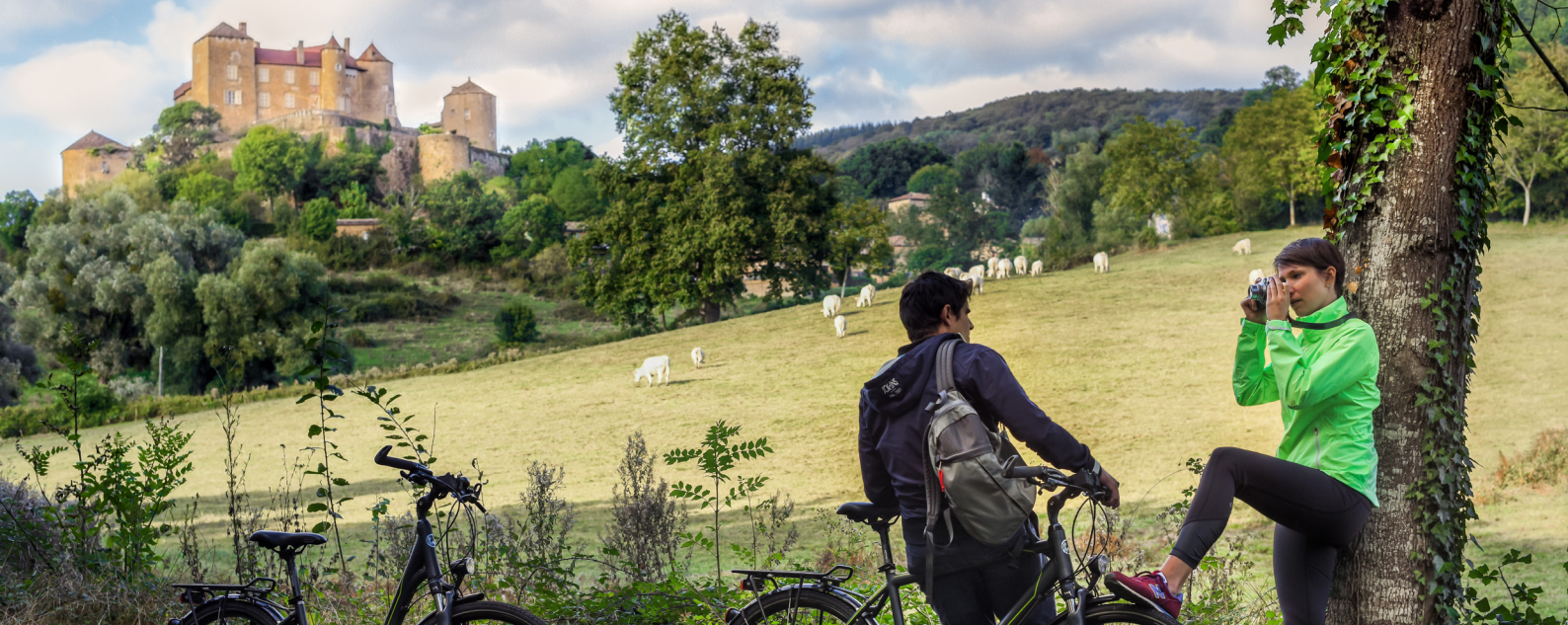
Point de vue sur le château de Berzé-le-Châtel depuis la Voie Verte