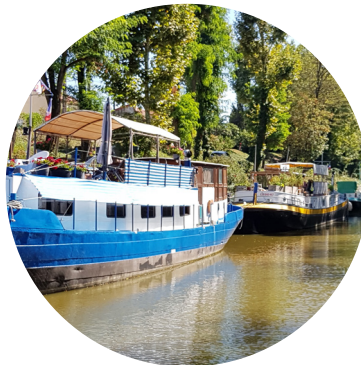
Chagny : bateaux sur le canal du Centre le long de la Voie Verte