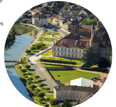
Paray-le-Monial : la basilique du Sacré-Coeur et la rivière Bourbince