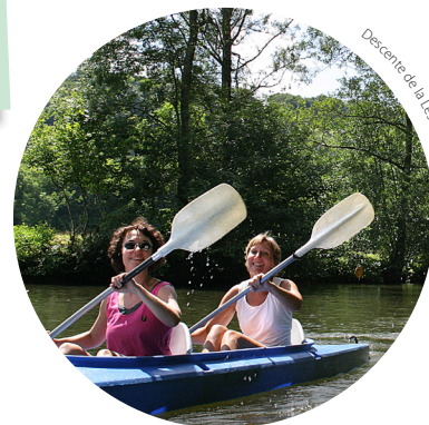
Descente de la Lesse en kayak