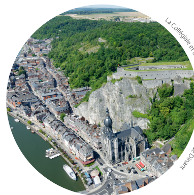
La Collégiale et la Citadelle de Dinant