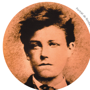
Portrait de Rimbaud