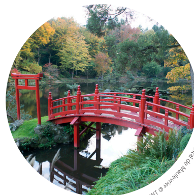
Parc oriental de Maulévrier