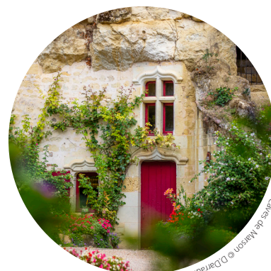
Les Caves du Marson