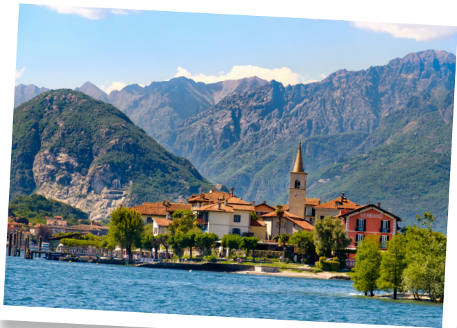
La romantique Isola dei Pescatori

Si vous voulez tenter l'autarcie énergétique ou le sevrage technologique , cap sur les îles qui ont fait le pari du développement durable, ou sur la belle Alicudi où vous n'aurez accès ni à Internet ni à la télévision.