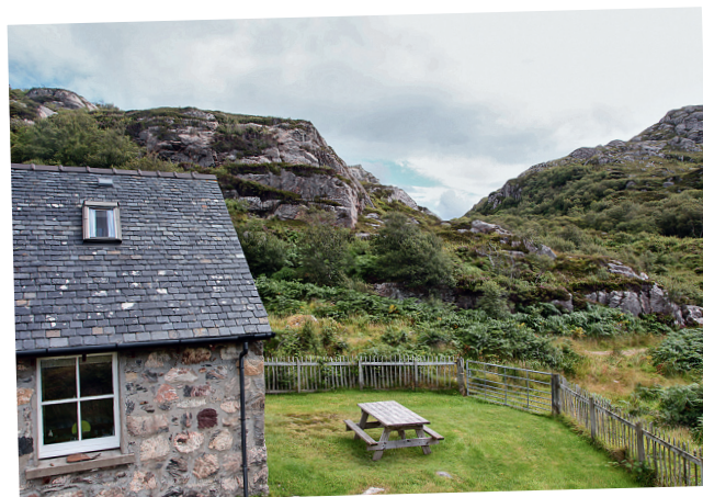
Rona © Etienne Brouillard

Si vous avez envie de pratiquer le sport en plein air , de nombreuses possibilités s'offrent à vous sur ces territoires où l'on respire mieux.