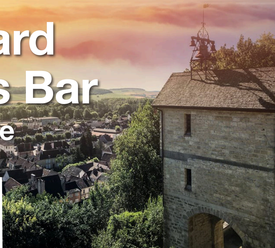
Tour de l'horloge

En librairie le 03 juin 2020 96 pages 4,90 €